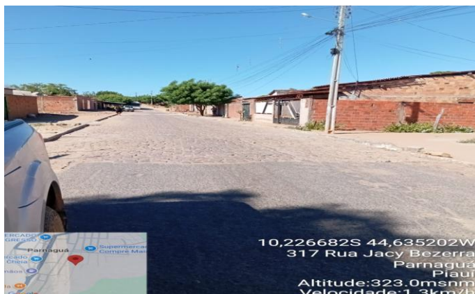
FOTO 03 - RUA JACY BEZERRA