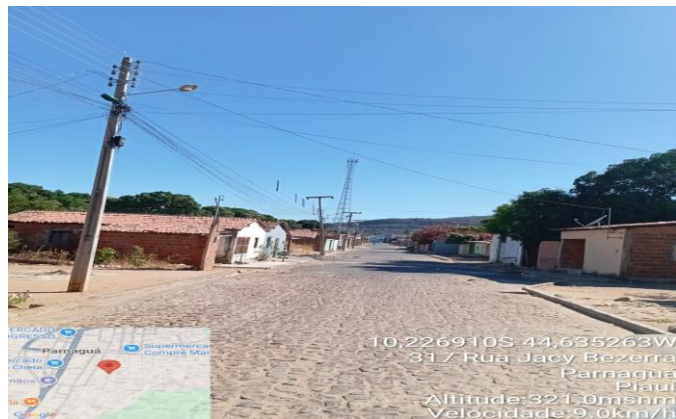
FOTO 04 - RUA JACY BEZERRA