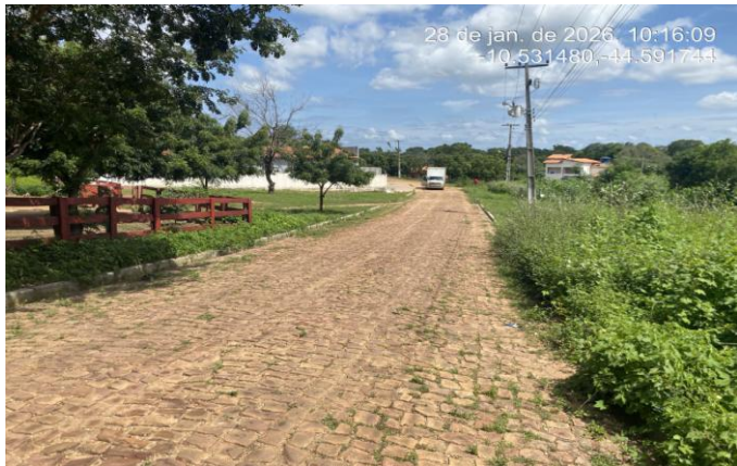
FOTO 04 - RUA PROJETADA