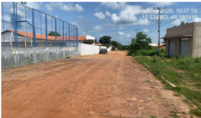
FOTO 01 - RUA PROJETADA