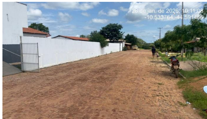
FOTO 02 - RUA PROJETADA