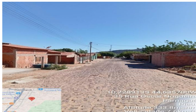
FOTO 02 - RUA JACY BEZERRA