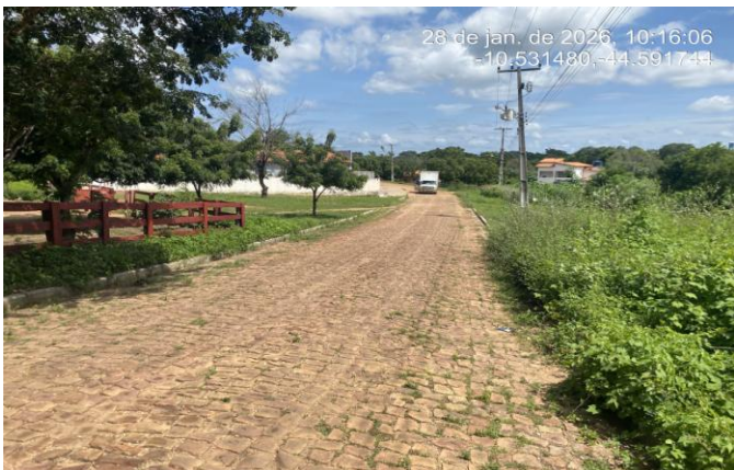
FOTO 03 - RUA PROJETADA